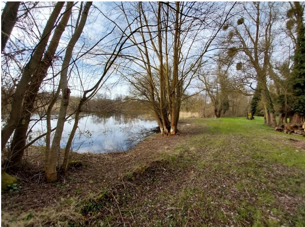
Vue dégagée sur les étangs