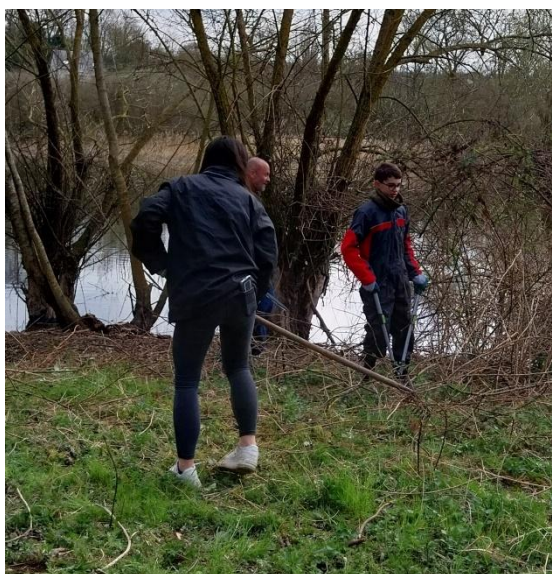
Un râteau, sécateur et surtout des gants

Un magnifique travail dans la bonne humeur, avec beaucoup d'huile de coude mais toujours avec le sourire.