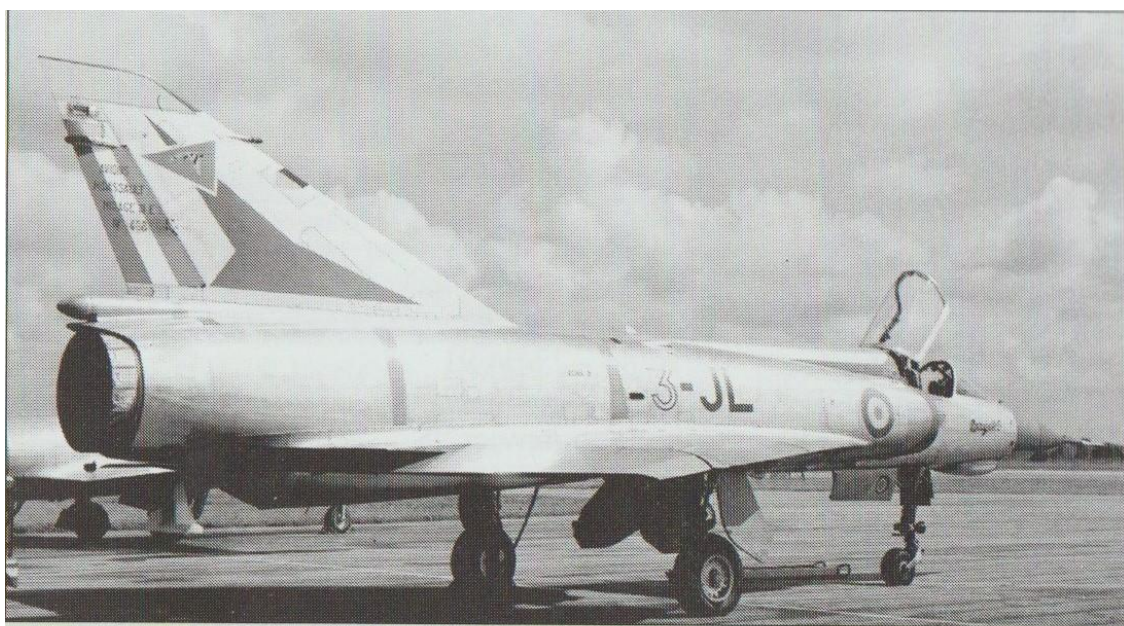
En escale sur la BA 102 de Dijon-Longvic le 16 septembre 1969, le "Juliet Lima" de l'EC 02/003 Champagne. (Bernard Régnier)

Détruit le 03/07/1974. Réformé le 05/02/1975 à 1936h35.