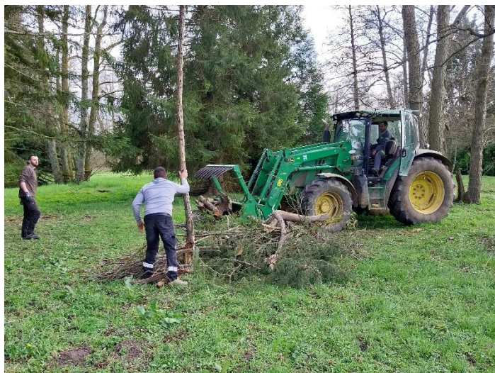
Les indispensables : le tracteur et son chauffeur