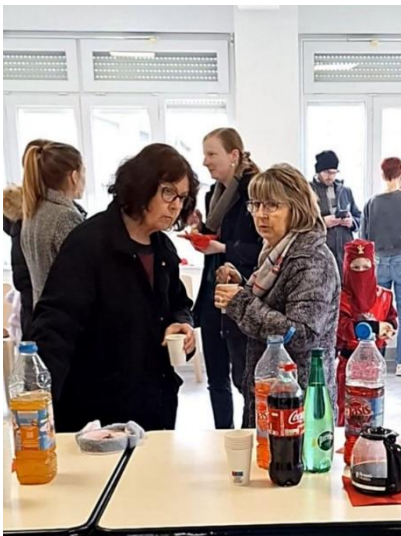
Les mamies se régalent