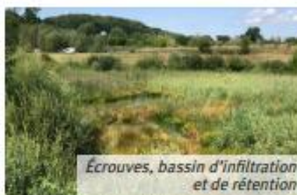
Écrouves, bassin d'infiltration et de rétention