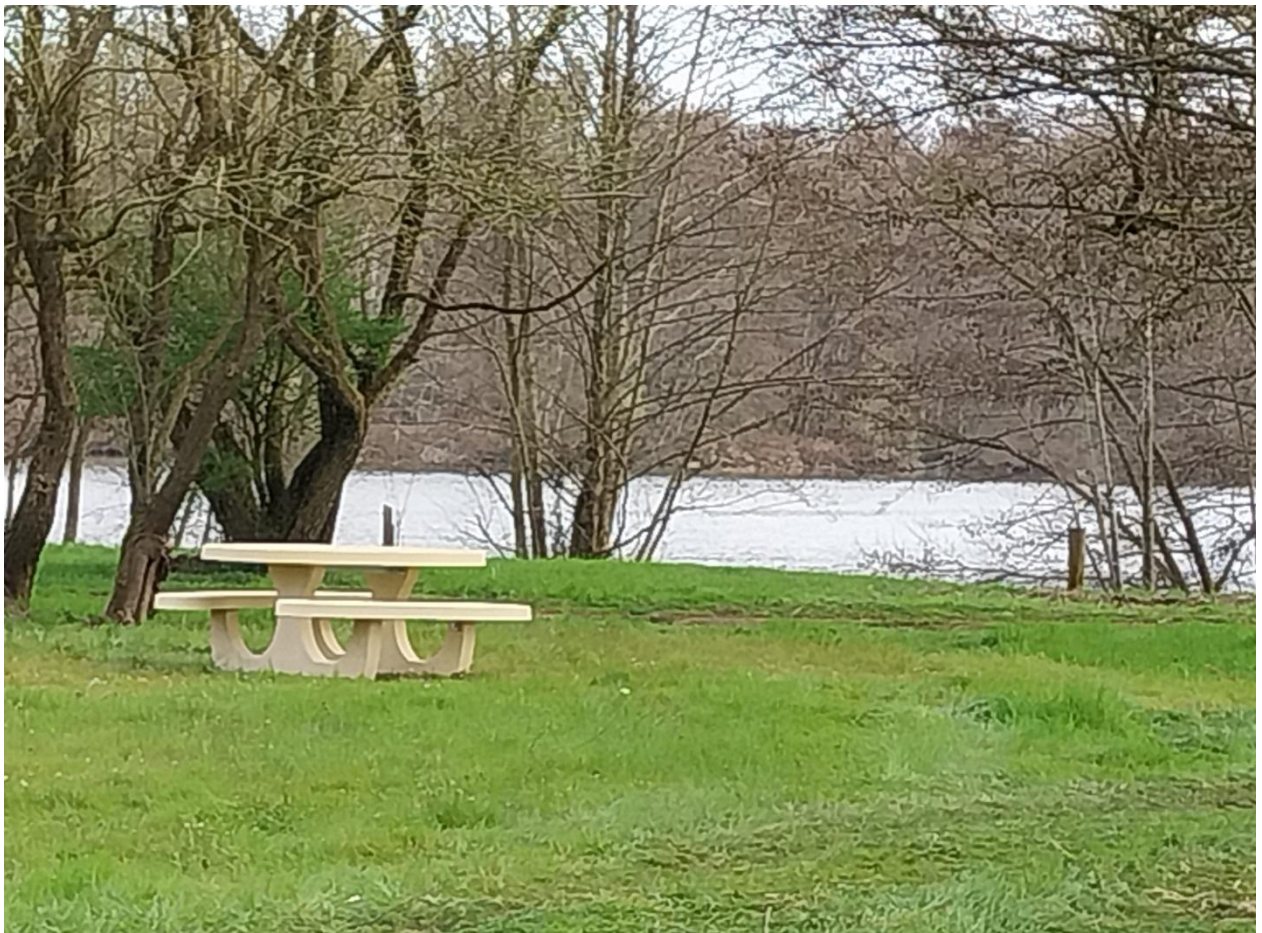
La nouvelle table trône fièrement