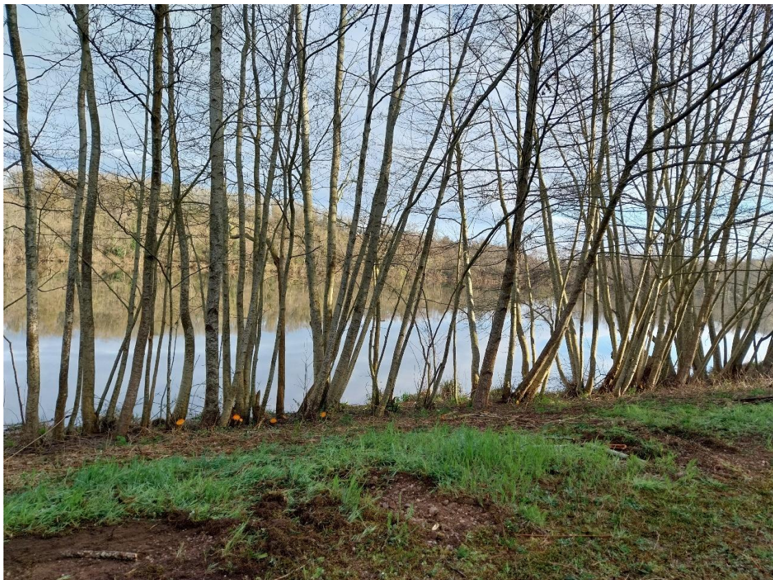
Vue aériée sur la Moselle après le travail accompli