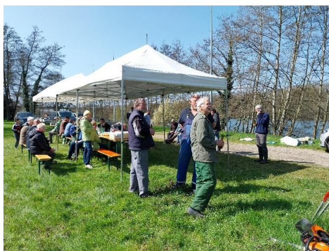
Préparation du casse-croûte offert par la commune