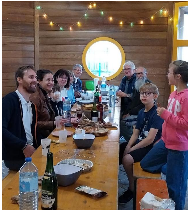
Intergénérationnelle cette fête !