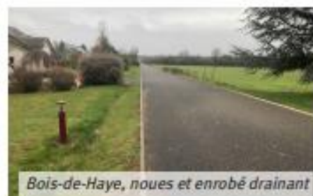
Bois-de-Haye, noues et enrobé drainant

La meilleure option ? Laisser l'eau s'infiltrer là où elle tombe. Dans l'espace public, cela passe par l'aménagement de noues, de fossés végétalisés ou encore de sols drainants. Chez les particuliers, cela peut être aussi simple que débrancher ses gouttières du réseau ou installer un récupérateur d'eau de pluie.