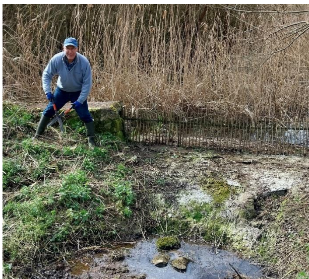
Albert le champion du déversoir