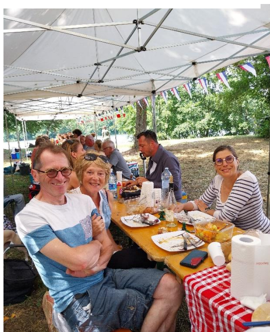
Avec le sourire