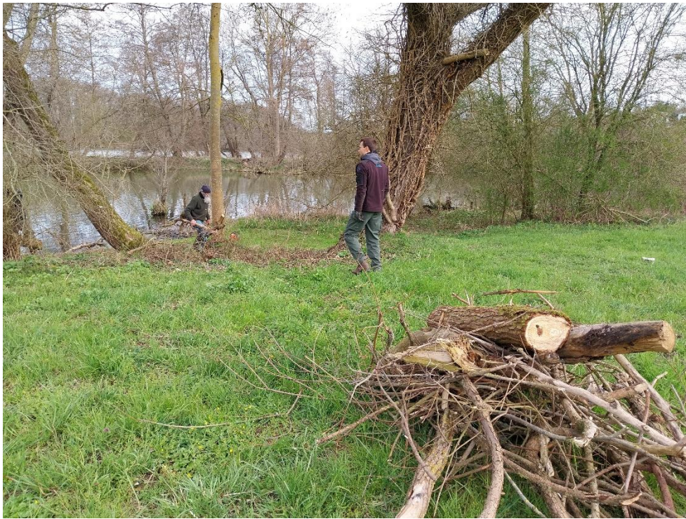
Les branches dangereuses ont été coupées