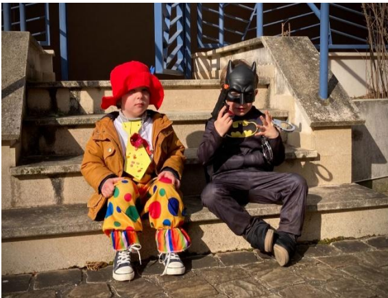
Le clown & Batman heureux au soleil