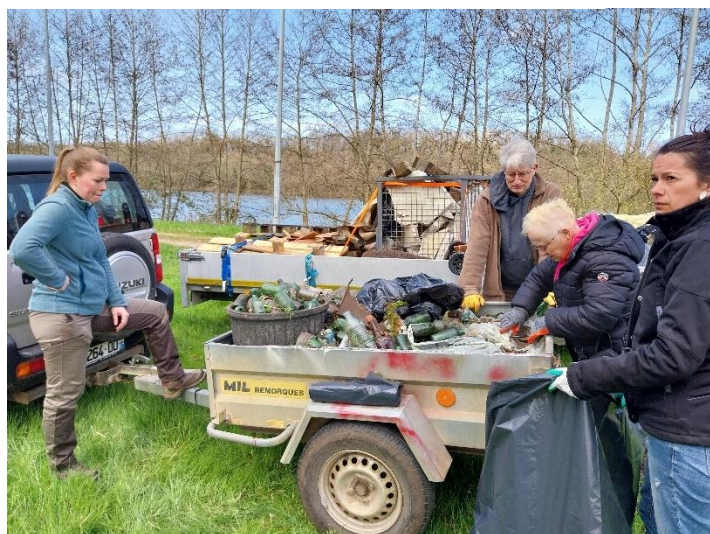
2 remorques de détrit