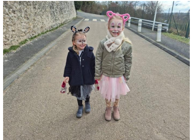
Deux jolies petites filles prennent la pose